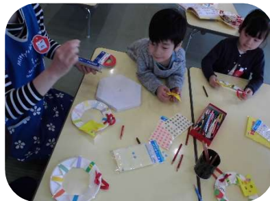
どうやって作るの？